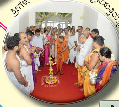
ಶ್ರೀಗಳು ದೀಪ ಬೆಳಗಿ ಉದ್ಘಾಟಿಸುತ್ತಿರುವುದು